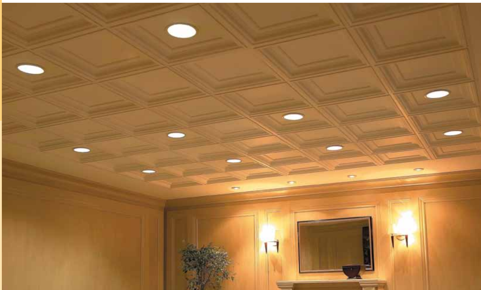
Caissons de plafond ELEGANCE Linéaire Tuscan