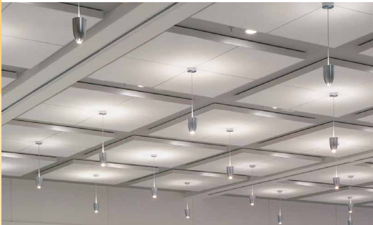
Garniture de périmètre COMPÀSSO avec panneaux de plafond HALCYON CLIMAPLUS/système de suspension DX DONN FINELINE