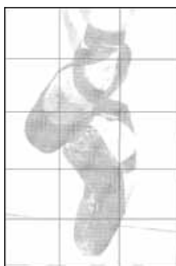
Toile de 6 x 10 pi (représenté au moyen de panneaux de 2 x 2 pi)

Aucune limite aux dimensions de l'image ou de la toile (surface totale du plafond contenant l'image)